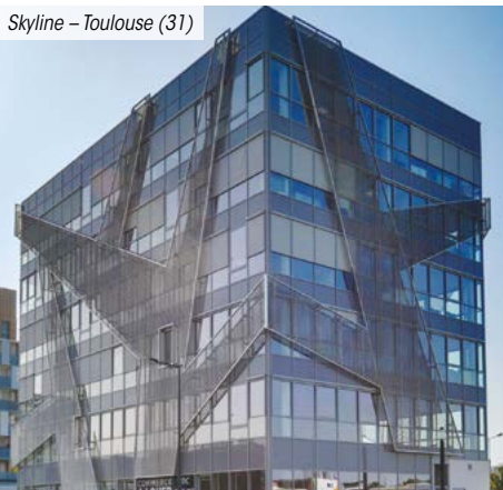
Skyline – Toulouse (31)

*** Pour les non résidents seuls les immeubles détenus en France sont pris en compte.