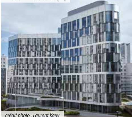
Ampère E+ – Courbevoie (92)

*** Pour les non résidents seuls les immeubles détenus en France sont pris en compte.